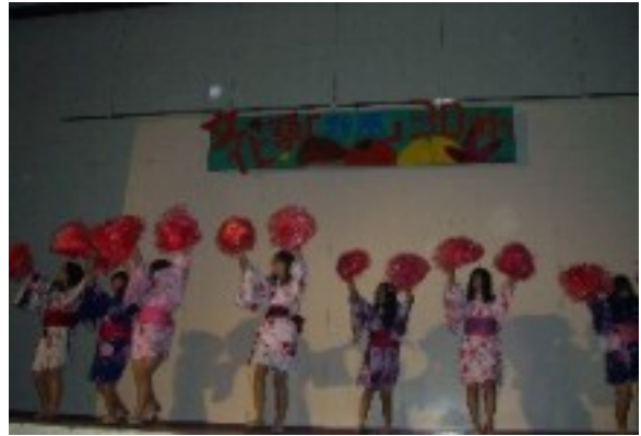
2年3組 一致団結賞の演技