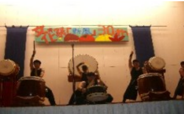
瑞宝太鼓による迫力ある演奏