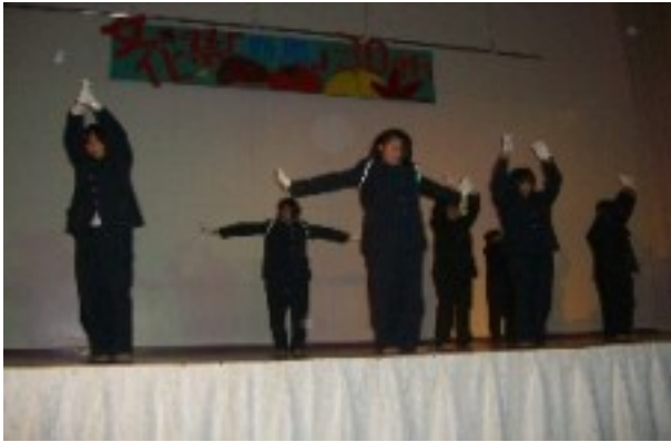
2年1組「新風」賞 女子による応援活動の演技

「新風」賞 2年1組 一致団結賞 2年3組 アイデア賞 2年2組 特別賞 1年3組