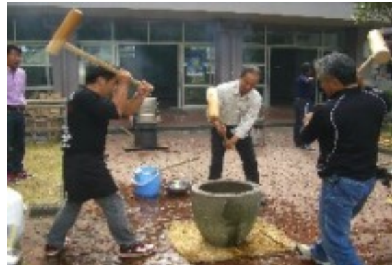
PTA・親志の会による餅つき