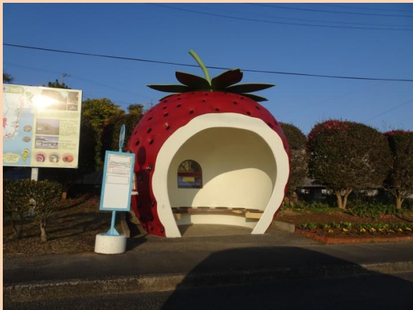
フルーツバス停 (いちご)